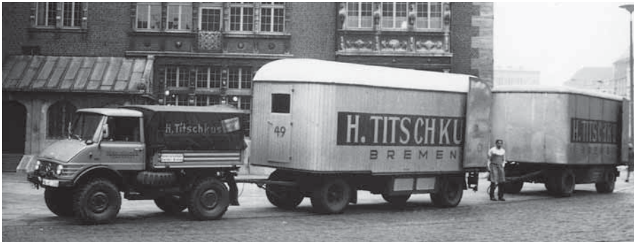
Der typische Anblick einer Umzugskombination, hier mit einem Unimog.