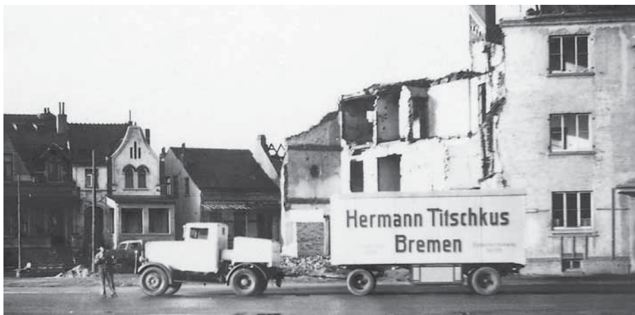
Hier lieferten die Mitarbeiter ein Modell des Schnelldampfers „Bremen“ aus.