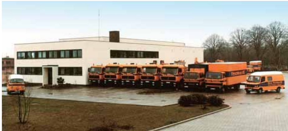
Im Jahr 1983 zog Mennen & Wittrock nach Bremen-Stuhr, direkt an die A 1.

Erfreulich: Noch heute existiert die Spedition Titschkus KG Schwerguttransporte unter dem Dach der Unternehmensgruppe Mennen & Wittrock. Im Fuhrpark stehen mittlerweile 40 unterschiedliche Schwerlastmaschinen sowie verschiedenste Anhängerkombinationen, die auf ihre Einsätze warten. Häufig begleiten sie dabei die Autokrane von Mennen & Wittrock.