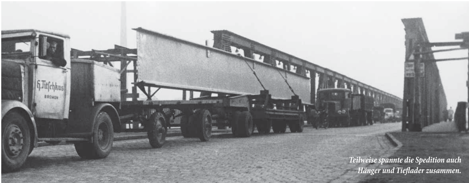
Teilweise spannte die Spedition auch Hänger und Tieflader zusammen.

porten laufen. Lukrative Aufträge gab es immer wieder.