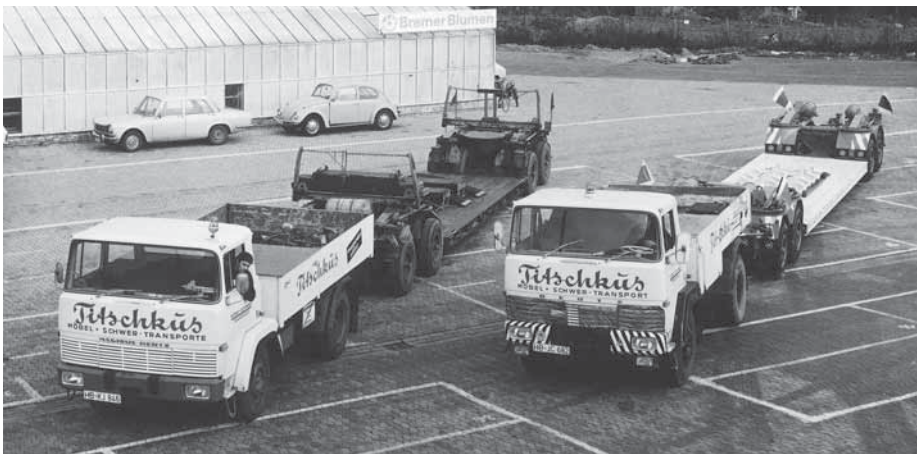
Diese beiden luftgekühlten Magirus-Deutz gehörten beim Verkauf zum Fuhrpark.

1978 übernahm Mennen & Wittrock die Spedition Hermann Titschkus – zum Preis von 350.000 D-Mark