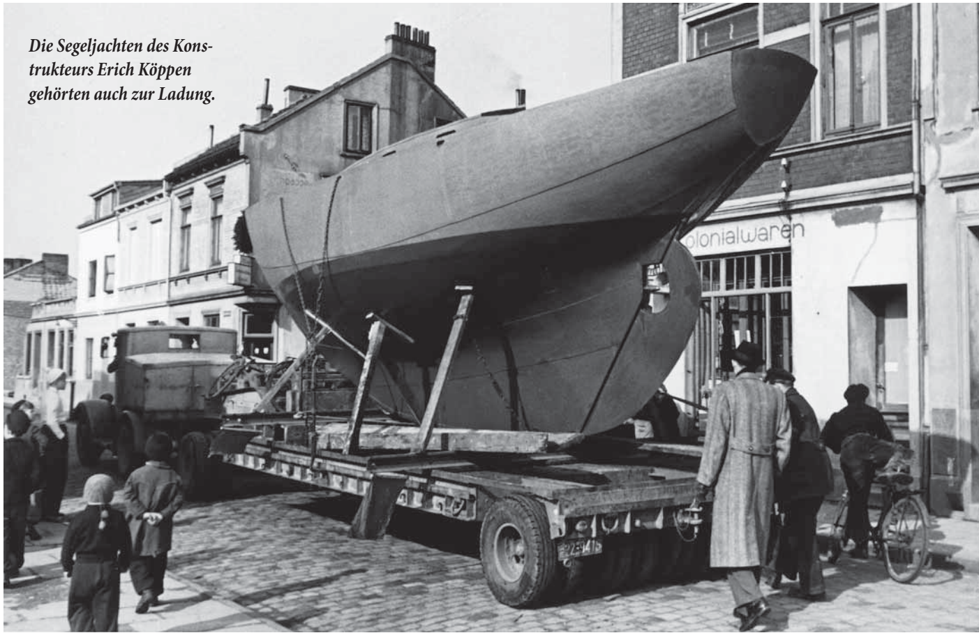
Die Segeljachten des Konstrukteurs Erich Köppen gehörten auch zur Ladung.

Werft AG Weser jetzt vermehrt U-Boote baute und Focke-Wulf Flugzeuge entwickelte, die für den Kriegseinsatz dringend benötigt wurden.