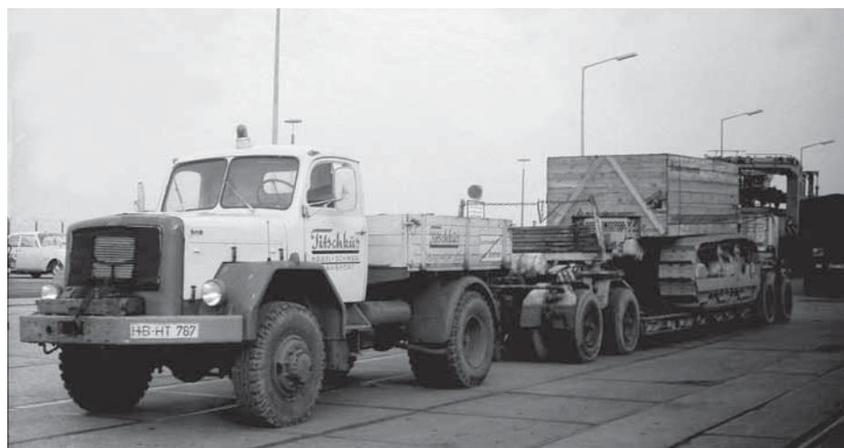
Der Hauber von Magirus-Deutz gehörte in den 60ern zum täglichen Bild auf der Straße.