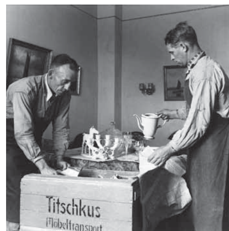
Fingerspitzengefühl war oft notwendig.