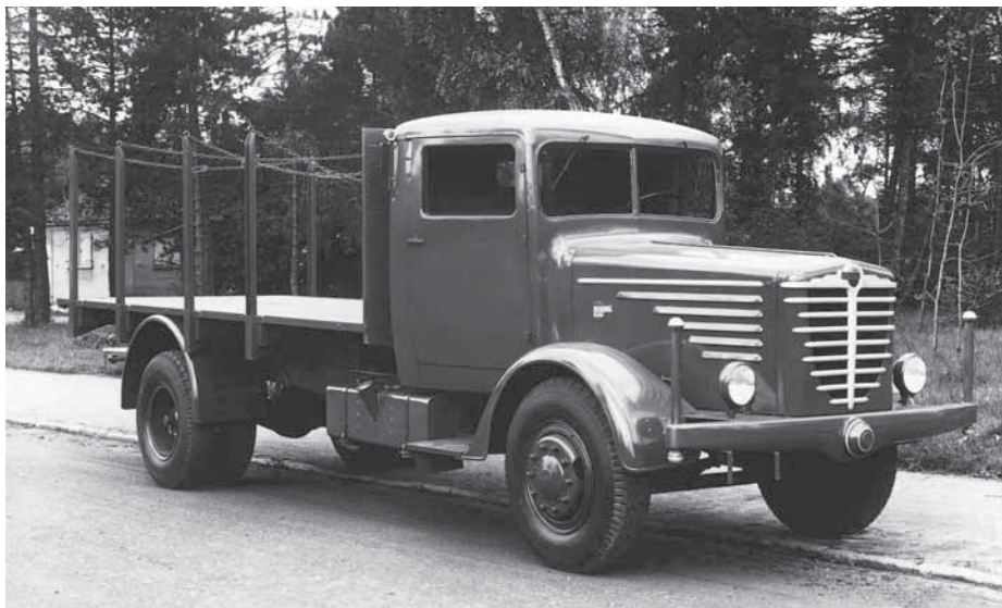
Auch ein Büssing 5000 S gehörte viele Jahre zum Fuhrpark.