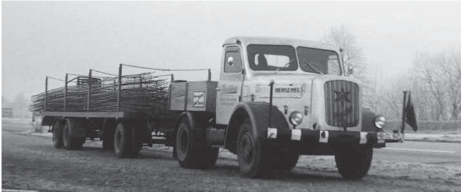
Ein Henschel HS 140 transportiert Baumaterial.