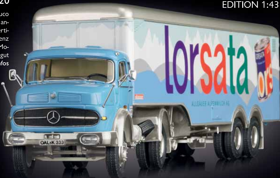
Mercedes-Benz LS 1620 „Lorsata“ Koffersattelzug 45 035 9600