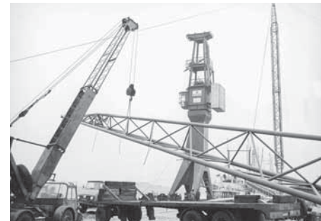
Kranarbeiten bei Mennen & Wittrock.

Dabei blieben die Transportarten relativ konstant. Nur an Schiffstransporte konnte das Unternehmen nicht mehr anknüpfen. „Wir haben das zwar mal probiert. Doch dafür benötigt man sehr tief liegende Tief-lader. Damit schränken wir das Einsatzgebiet sehr ein“, erläutert Wittrock. Doch noch immer gilt das Firmenmotto aus den Anfängen des vergangenen Jahrhunderts: „Titschkus fährt alles.“ Beispielsweise bewegte das Unternehmen in den vergangenen Jahren U-Boote, Windkraftanlagen