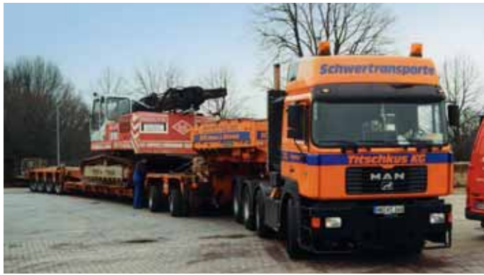
Starke MAN wie der 41.604 V10 gehörten lange zur Spedition.