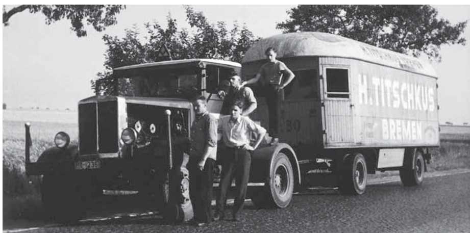
Eine kleine Pause für Motor und Mannschaft.

Mit dem Bau neuer Autobahnen rund um Bremen verlagerte sich das Geschäft Ende der 50er-Jahre und in den 60ern immer mehr in Richtung Baumaschinen-transporte. Die Spedition Titschkus hatte sich in den vergangenen Jahrzehnten den Ruf erarbeitet, pünktlich und zuverlässig zu sein und darauf setzten viele Bauunternehmen. Nebenbei ließ die Spedition weiterhin das Geschäft mit den Möbeltrans-