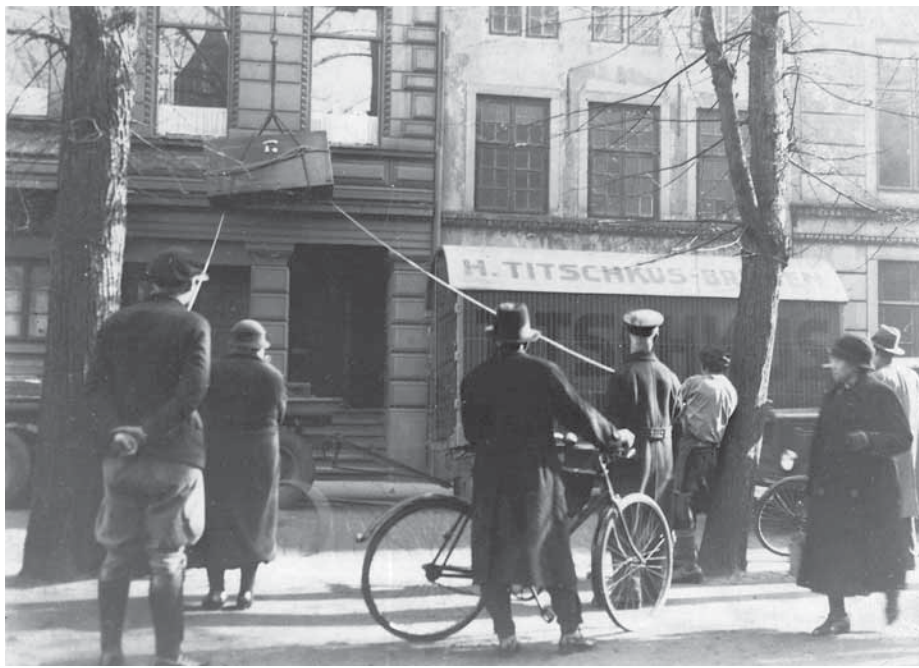
Möbeltransporte gehörten bis in die 70er-Jahre zu den Leistungen der Spedition.