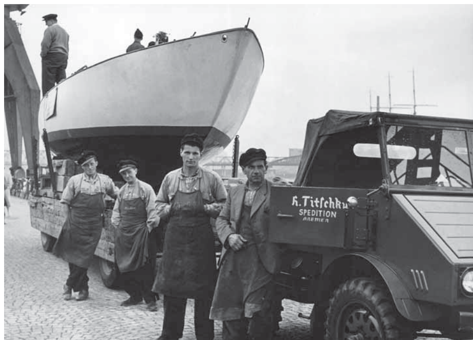
Die Schiffseigner hatten immer gerne einen Blick auf ihre Schätzchen.