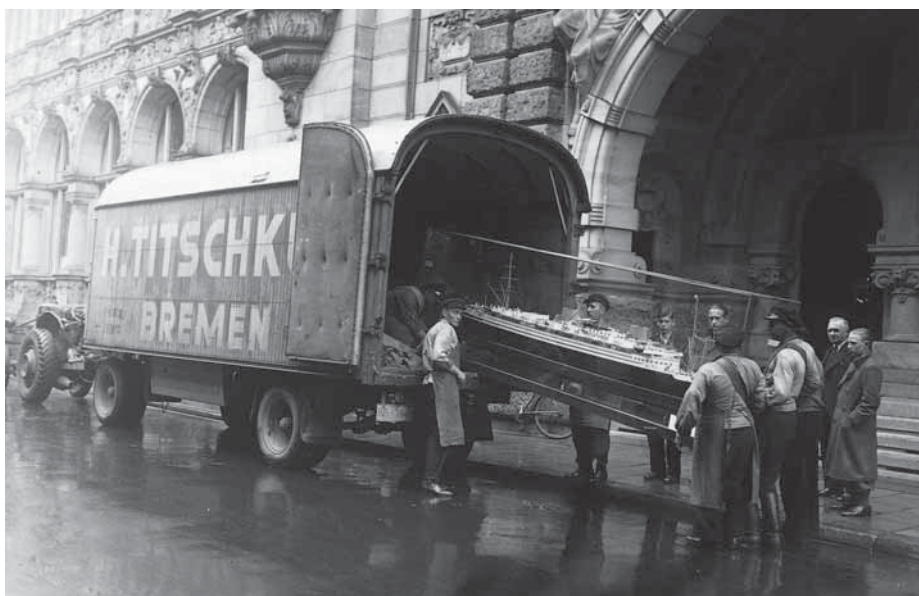
Die echte „Bremen“ überquerte den Atlantik im Juli 1929 in Rekordzeit.