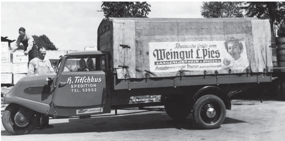
Beim Tempo war Vorsicht geboten. Er kippte leicht um.