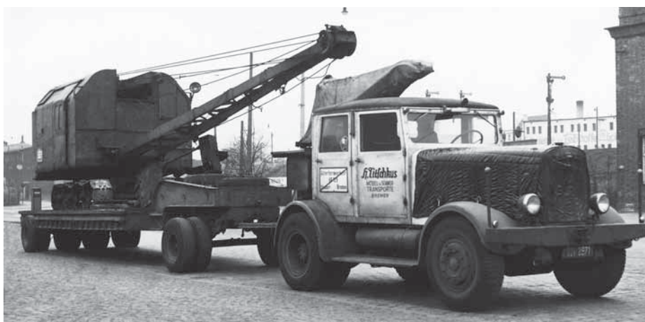
In den 50ern begann Titschkus mit dem Transport von Baufahrzeugen.

bei Schwertransporten viele Jahre einige Hanomag vom Typ SS 100, wobei SS für Straßenschlepper stand – was andeutete, wo das Einsatzgebiet des Lkw lag.