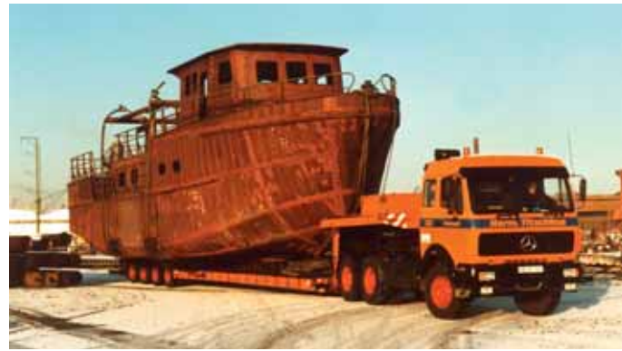
Schifftransport der besonderen Art mit einem Mercedes-Benz 2636 S.

oder Flugzeugteile des Airbus. Den größten Teil verbringen die Schwerlastzüge jedoch immer noch mit dem Transport von Baufahrzeugen.