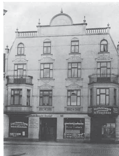
Der Sitz der Spedition Titschkus in Bremen.

1918 startete er erneut durch. Nach dem Krieg erhielt er immer mehr Aufträge von der Industrie. So kam es dazu, dass er häufiger Maschinen transportierte und sich mehr und mehr auf besondere Aufgaben konzentrierte.