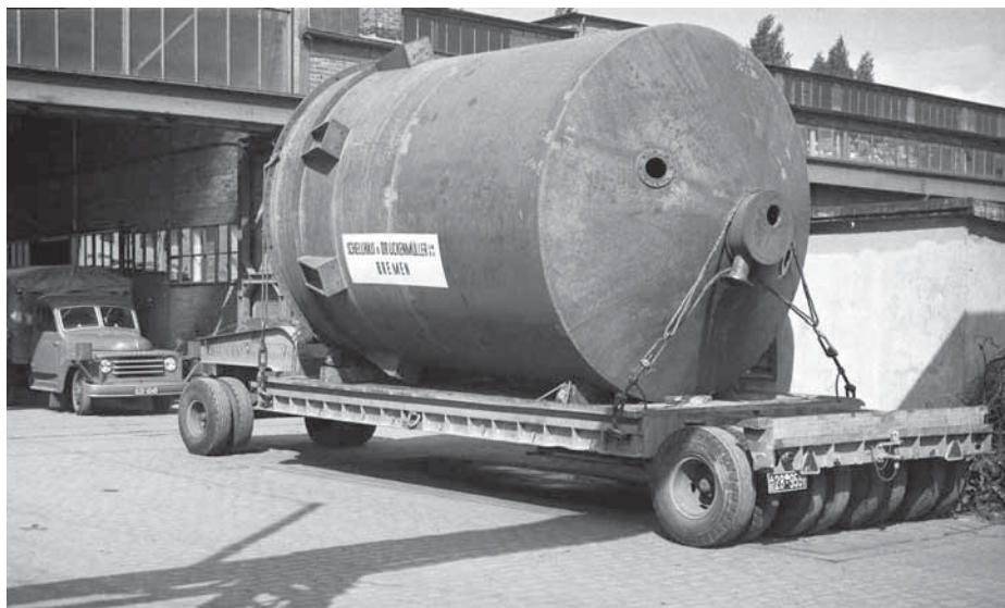
Ob Kessel oder U-Boot, das Motto „Titschkus transportiert alles“ traf auf den Punkt.

Fahrzeuge von Bunge, Goldhofer oder Kässbohrer im Fuhrpark. Generell setzte er bei der Fahrzeugauswahl gern auf einheimische Produkte, die in der Nähe gebaut wurden. Das Bunge-Fahrzeugwerk hatte seinen Sitz ebenfalls in Bremen. Auch bei den Zugmaschinen liebäugelte der Geschäftsführer mit norddeutschen Herstellern. So fuhr das Unternehmen